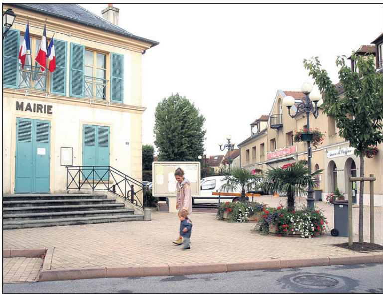
SACLAY. Les habitants du bourg redoutent l'urbanisation des terres agricoles avec l'implantation massive de logements.